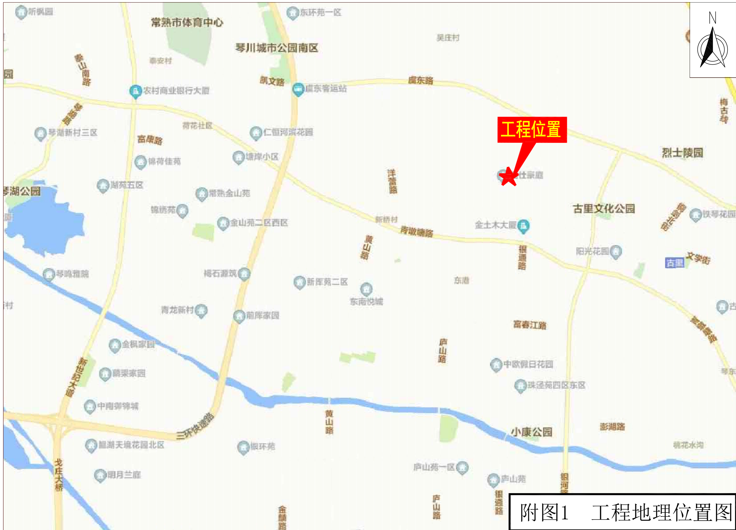
附图1 工程地理位置图